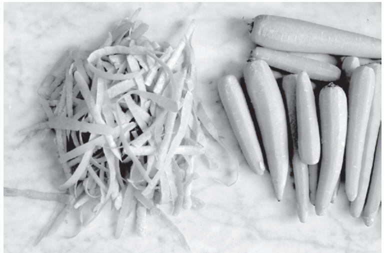
Fotoessay (Un-)Ordnung von Arne Reinhardt, Foto 3

Merkwürdigerweise empfinden manche Menschen das als eher trauriges ZITAT. ■